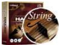
Halion String Edition