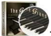
The Grand 2